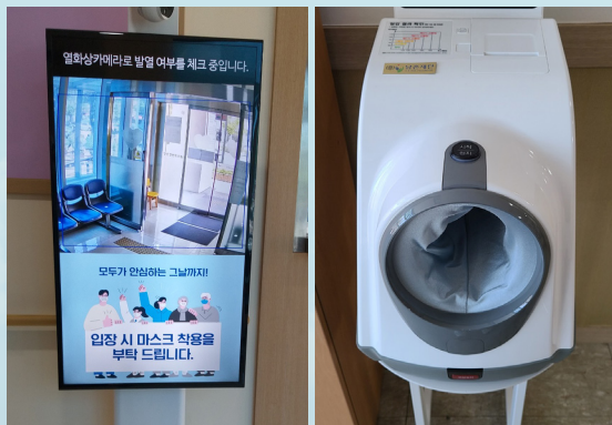
▲ 열화상 카메라(안산빈센트의원)

2021년에는 안산빈센트의원, 라파엘클리닉(서울), 요셉의원, 라파엘클리닉(천안)에 코로나19 감염 예방과 확산방지를 위한 소독 관련 기기와 비대면 진료 등을 위한 보조기구들을 적절한 시기에 지원했습니다.